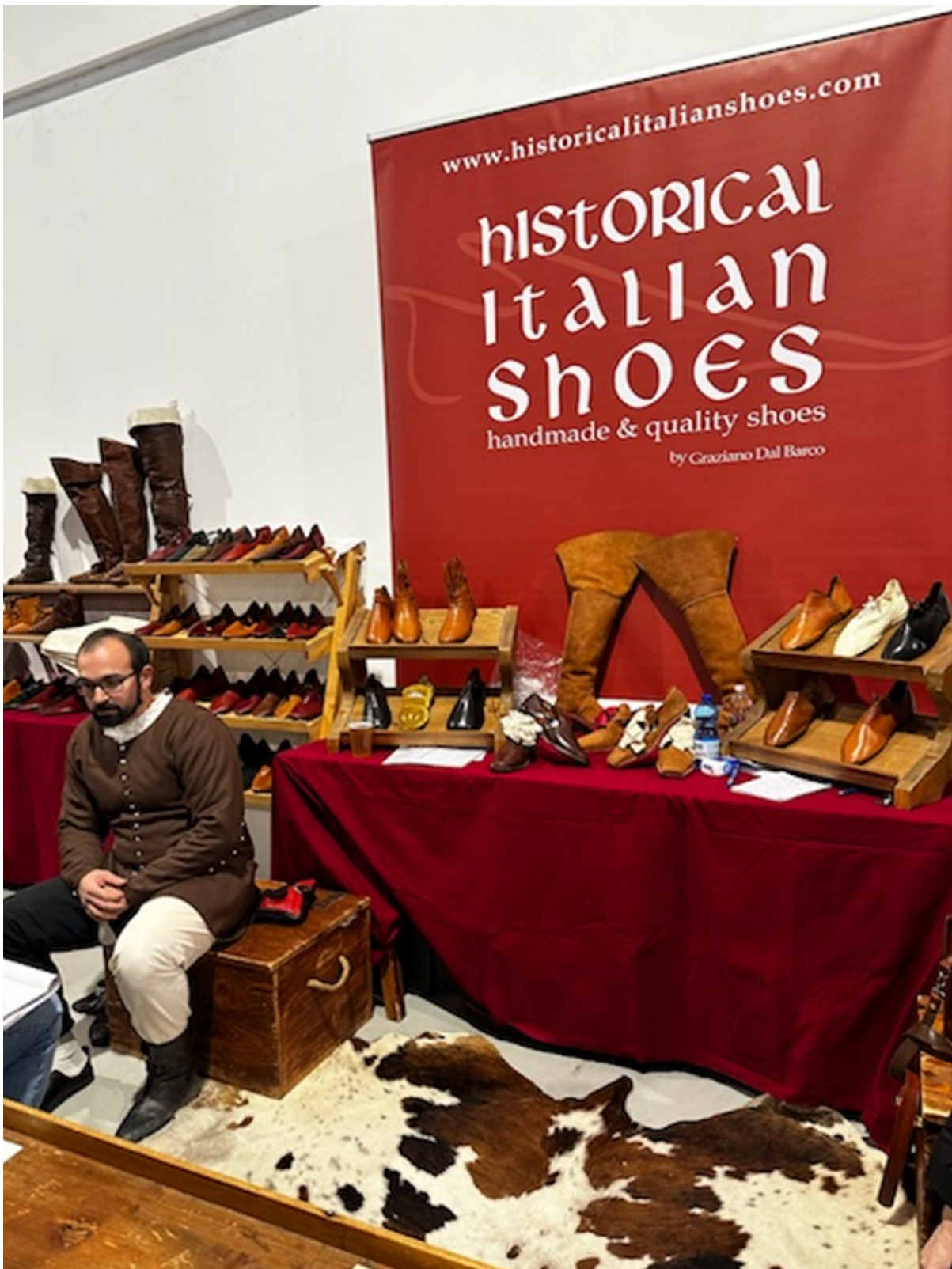
Fig. 2 Banchi di artigiani alla fiera Usi&Costumi (Ferrara 2024) © Enrica Salvatori.

Si tratta di attività e prodotti indubbiamente specialistici e di nicchia, formalmente portati avanti da associazioni o piccole imprese, oggi rappresentate in almeno due fiere nazionali: Armi&Bagagli a Piacenza, nella primavera che precede la stagione rievocativa, e Usi&Costumi a Ferrara alla chiusura autunnale. La prima fiera esiste dal