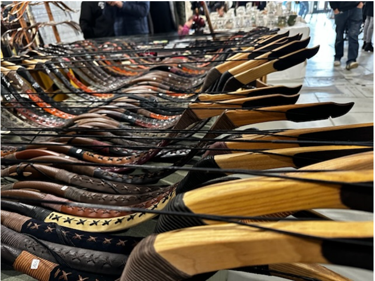
Fig. 1 Banchi di artigiani alla fiera Usi&Costumi (Ferrara 2024) © Enrica Salvatori.